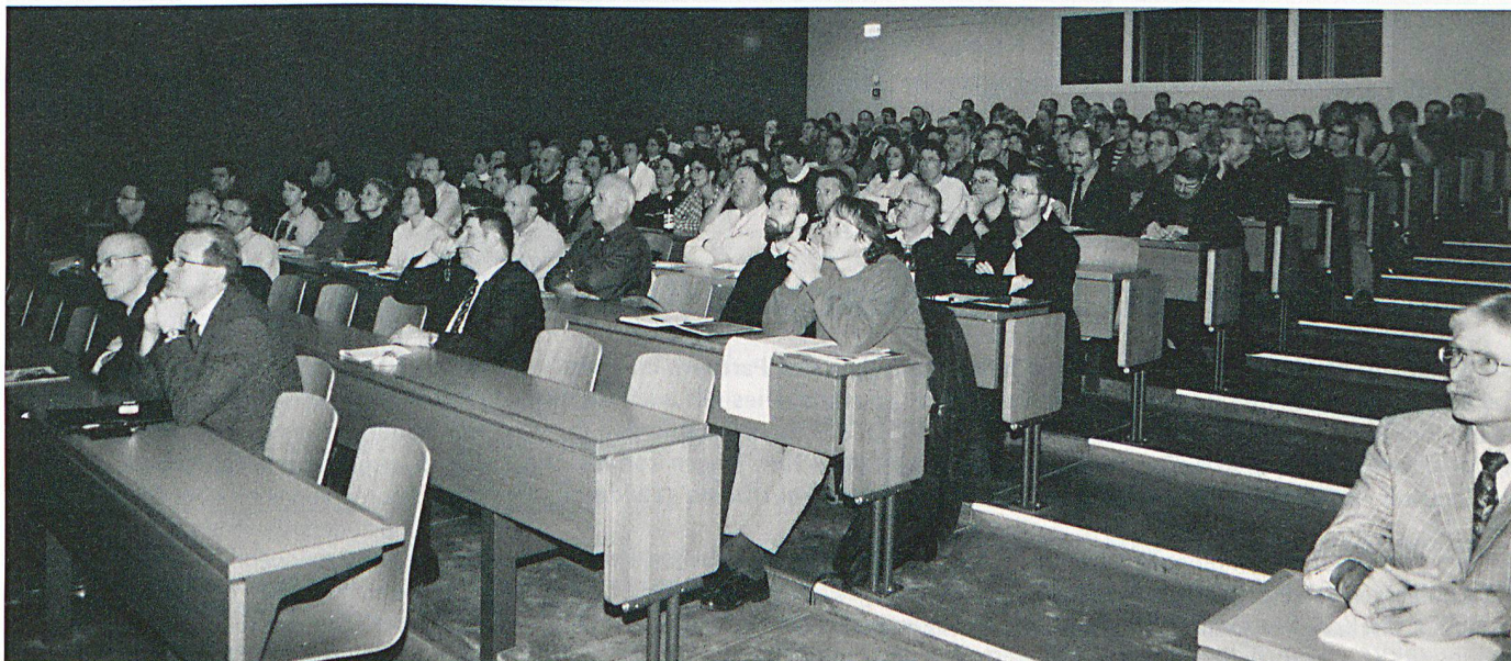
Sehr aufmerksam und gespannt wurde den interessanten Referaten zugehört.