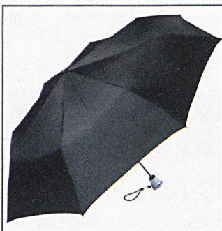
SZSV-Taschenschirm Fr. 20.– + MwSt.

Im Rahmen der Überarbeitung der Bevölkerungsschutz-Website wurden insbesondere die Informationen zum Zivilschutz aktualisiert und ergänzt. Über www.zivilschutz.ch sind nun auf mehreren Seiten Erläuterungen zum Auftrag des Zivilschutzes und zur Ausbildung im Zivilschutz zu finden. Auch im Bereich Dienstpflicht wurde die Website erweitert: So enthält sie neu Informationen zum Wehrpflichtersatz genauso wie zur Erwerbsausfallentschädigung, zur freiwilligen Übernahme der Schutzdienstpflicht oder der vorzeitigen Entlassung. □