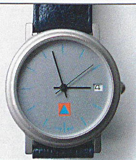
ZS-Armbanduhr Fr. 54.– + MwSt.