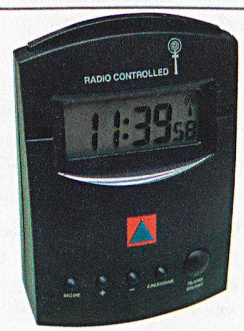
Funkwecker Fr. 34.– + MwSt.

Bestelladresse: Schweizerischer Zivilschutzverband, Postfach 8272, 3001 Bern, Telefon 031 381 65 81, Fax 031 382 21 02