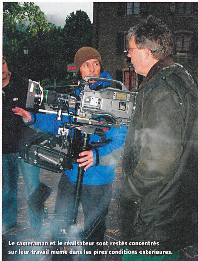
Le cameraman et le réalisateur sont restés concentrés sur leur travail même dans les pires conditions extérieures.