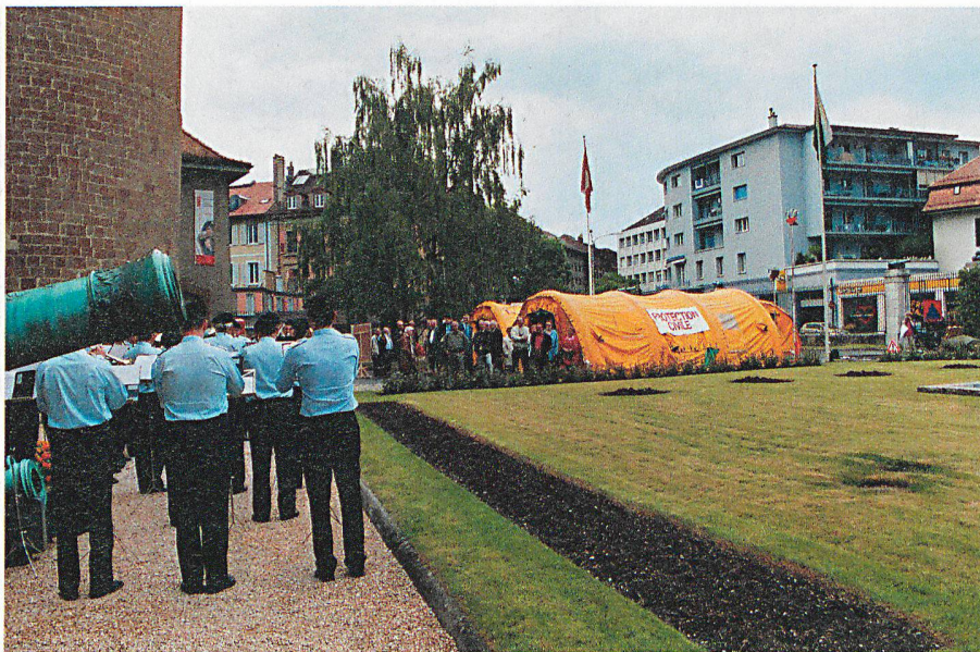
L'accueil des invités par la fanfare du SSCM.