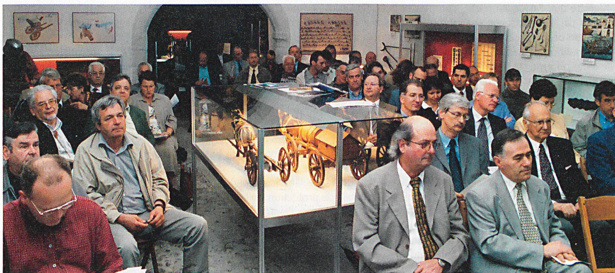
Les membres et les invités dans une des magnifiques salles abritant le Musée de l'artillerie.

président de l'ACVSPC. Les années 90 verront la régionalisation se mettre en place dans le canton. 1993 verra une première mue de l'association. Elle s'élargit et devient l'association cantonale vaudoise des cadres supérieurs. Enfin, c'est en 1999 que l'ACVCS deviendra l'Association cantonale vaudoise de la sécurité et de la protection civile. Quelques membres de l'ancienne l'AVPC (Association vaudoise de la protection des civils) rejoindront l'ACVSPC. Depuis 1999 elle est section de l'Union suisse pour la protection civile (USPC), à la place de l'AVPC. Pour Pierre Mermier, l'association doit rester un partenaire privilégié de l'Etat pour toutes les questions touchant à la sécurité de la population. Elle doit être un liant pour ses membres, mais aussi développer ses liens avec les autres sections de l'USPC.