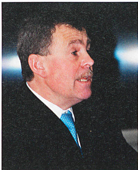
Ernst Stocker, président du Parlement du canton de Zurich.