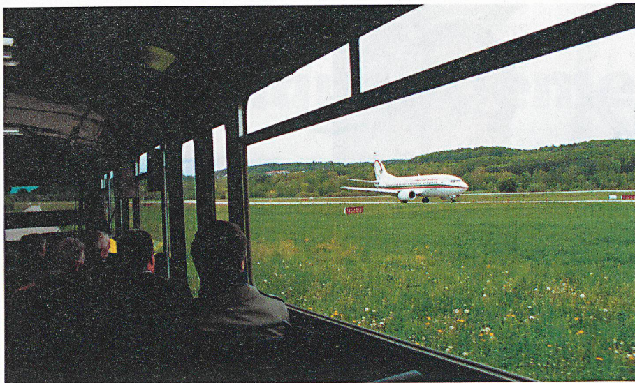
Visite de la zone aéroportuaire en bus spécial.