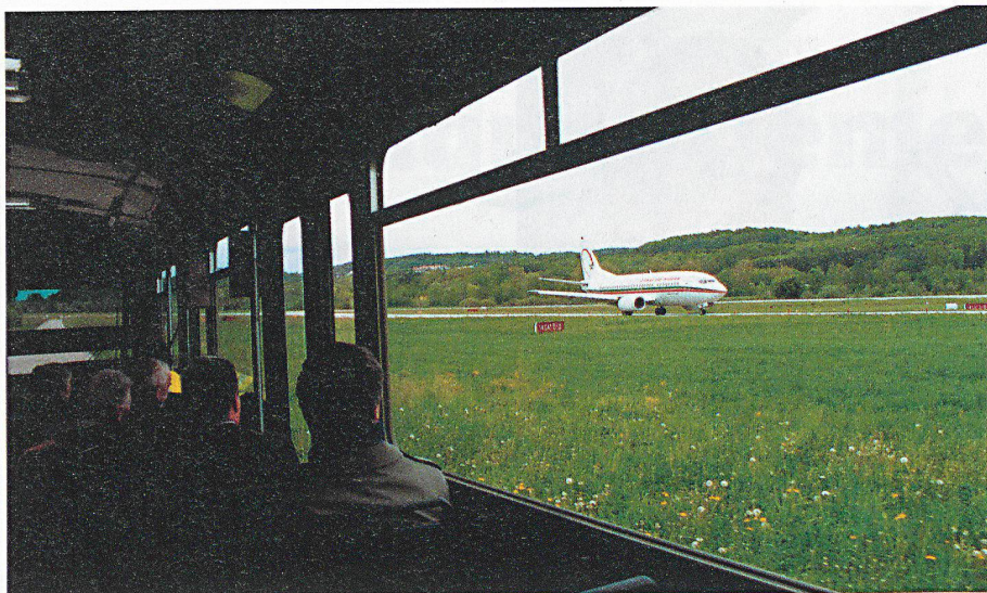
Visite de la zone aéroportuaire en bus spécial.