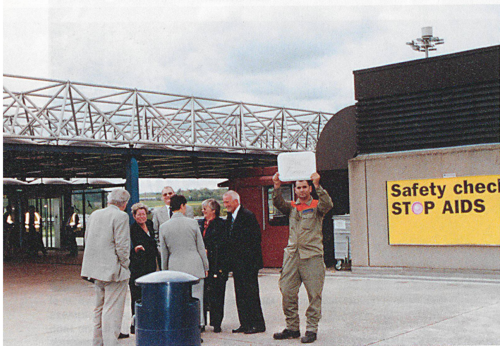
Safety check pour les Romands...

sur l'importance de la sécurité et de l'entraide. Pour lui, plus exactement pour un Etat responsable, la sécurité des citoyens est garante d'une bonne qualité de vie. Pour lui une réforme telle que celle qui se traduit par une protection de la population globale et intégrée est la réponse adéquate aux nouvelles menaces. Il est important que la protection civile rajeunisse en conservant des priorités claires ainsi qu'un degré de formation aussi intensif que polyvalent. Et de conclure par un sonore: «Le but de toute formation, c'est d'agir.»