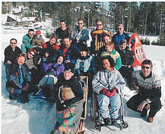
Die Kinder und Jugendlichen mit «ihren» Zivilschützern.

Spiel, Spass und gleichzeitig Weiterbildung: Schüler und Zivilschützer im freiburgischen Schnee.