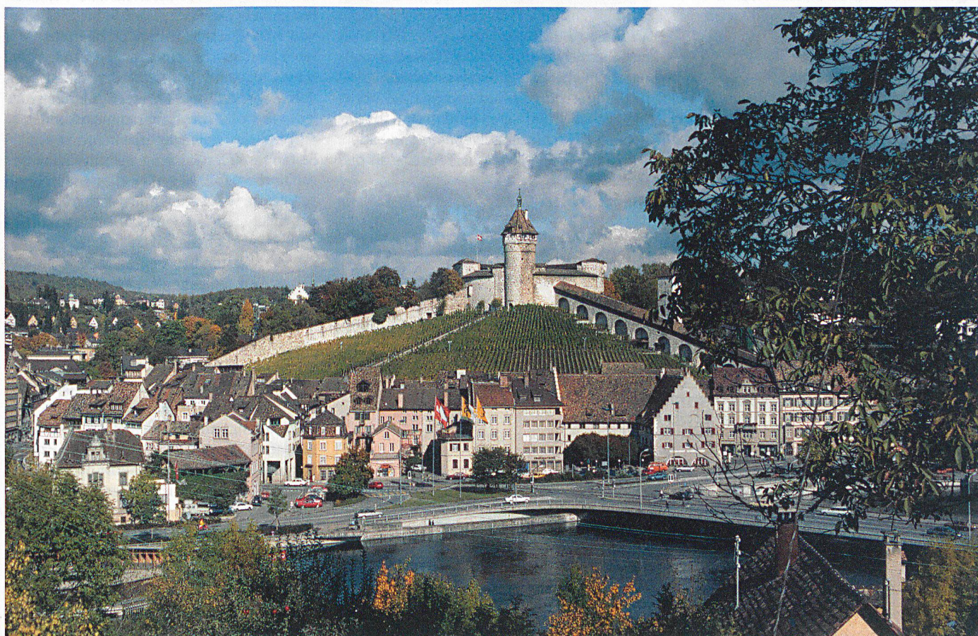
Der imposante Munot überragt die Stadt Schaffhausen.