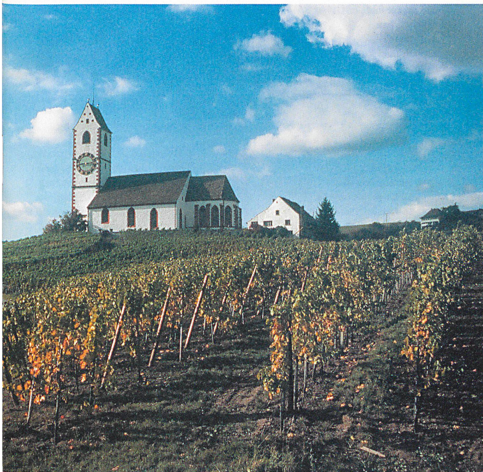
Weinbau im Kanton Schaffhausen.