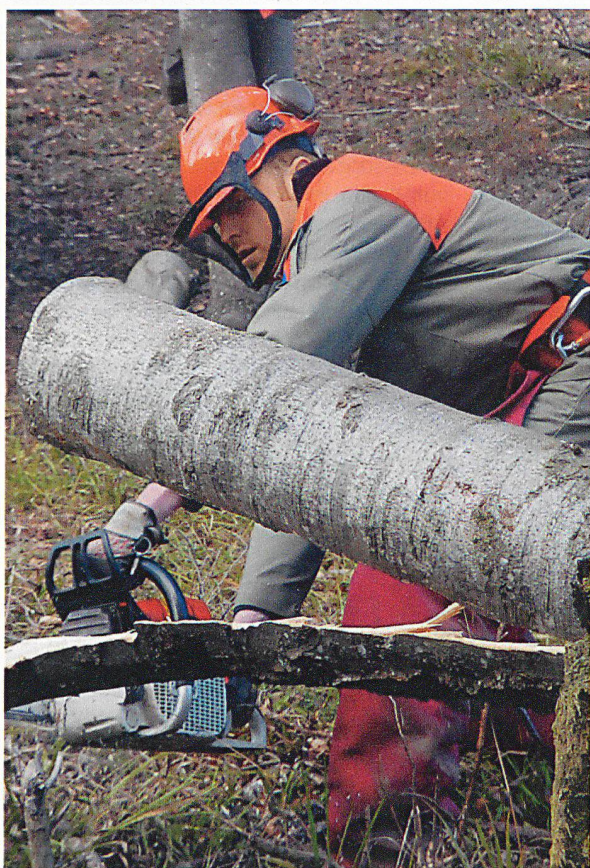
Der richtige (Fach-)Mann am richtigen Platz leistet vollwertige Arbeit.

Im Wissen, mit einer gut vorbereiteten und positiv eingestellten Mannschaft zur Stelle zu sein, wenn Ernstfallaufträge zu erfüllen sein würden, wurden die Männer mit bestem Dank und nach einem Filmrückblick aus dem WK entlassen. □