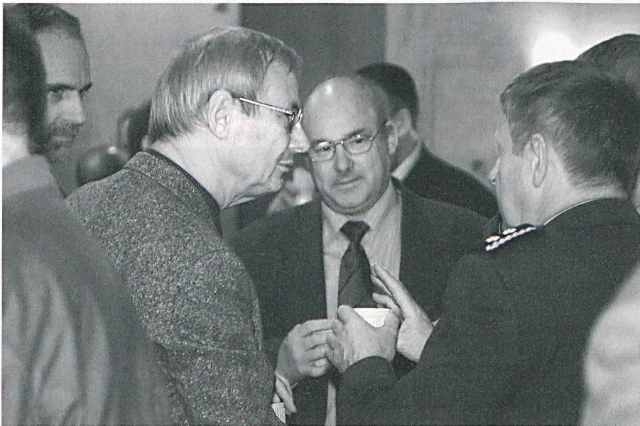
Discorsi animati tra i partecipanti della conferenza di Friburgo.