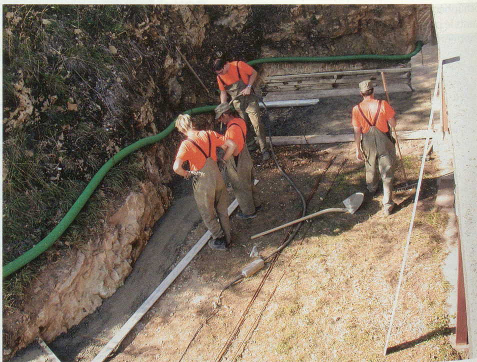
Assainissement: construction d'un mur et d'un drain.