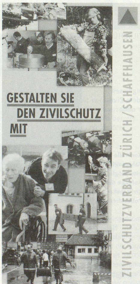
Der neue Werbeprospekt.