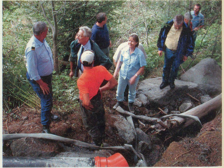
Besuch auf einer der Baustellen.