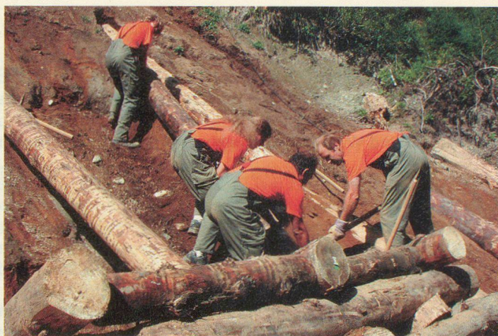
Gute Motivation trotz harter Arbeit.