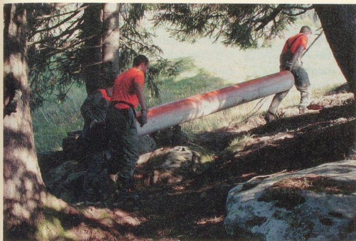
Apacken beim Verlegen einer Wasserleitung.