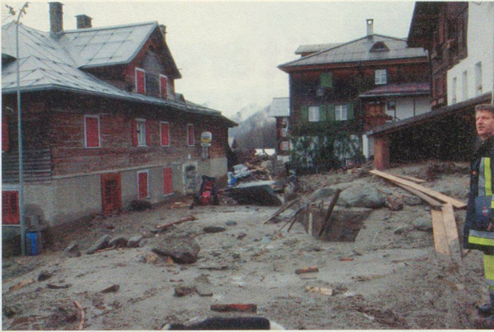
Verwüstungen im Dorfzentrum Schlans.