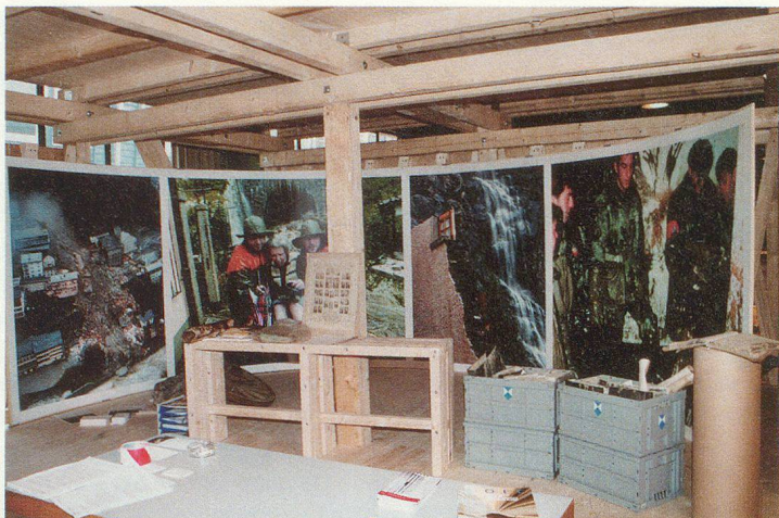
Le coin PBC.