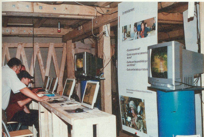
Le coin recrutement (armée et PCi).