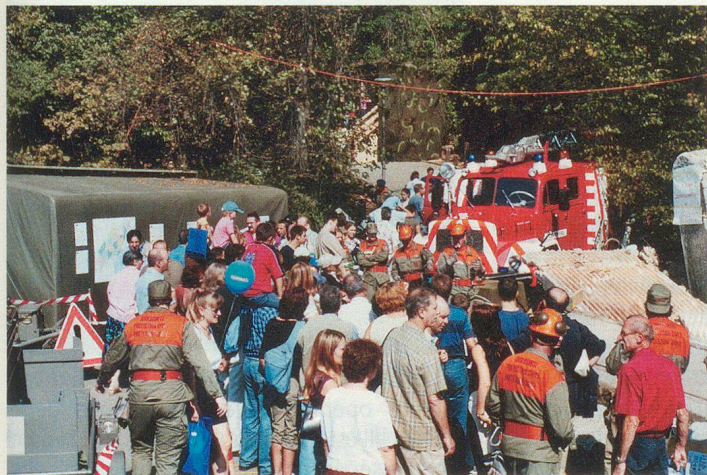
La PCi lausannoise en pleine démonstration.