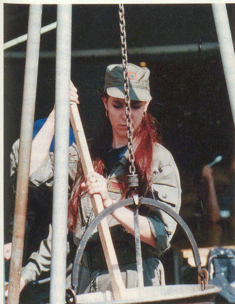
Un des symboles de l'assistance: la soupe à l'oignon.

de l'ensemble. D'autant que les explications patientes et convaincantes des membres de la PCi donnaient tout de même à penser au citoyen qu'il s'agissait bien là d'un des partenaires de cette fameuse protection de la population.