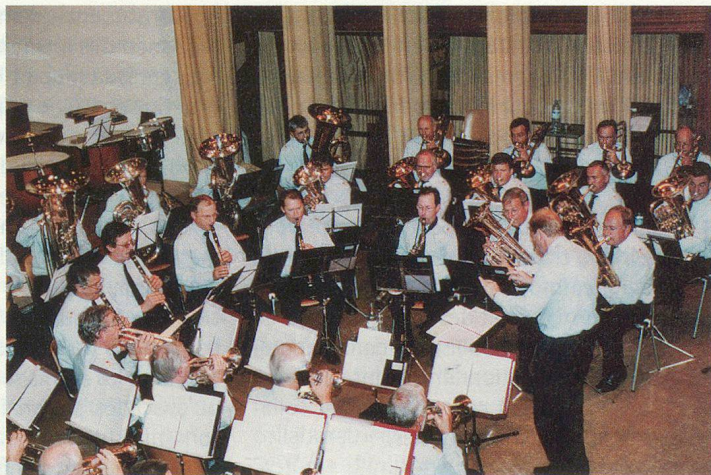
Tout se termine en musique: la fanfare de la PCi cantonale vaudoise.