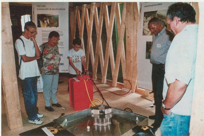
Exercice d'habileté avec des coussins de levage.