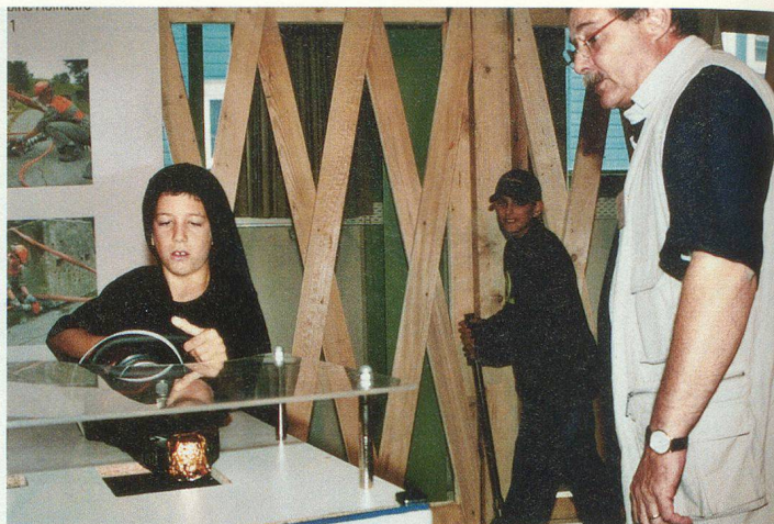
Un des succès du stand.