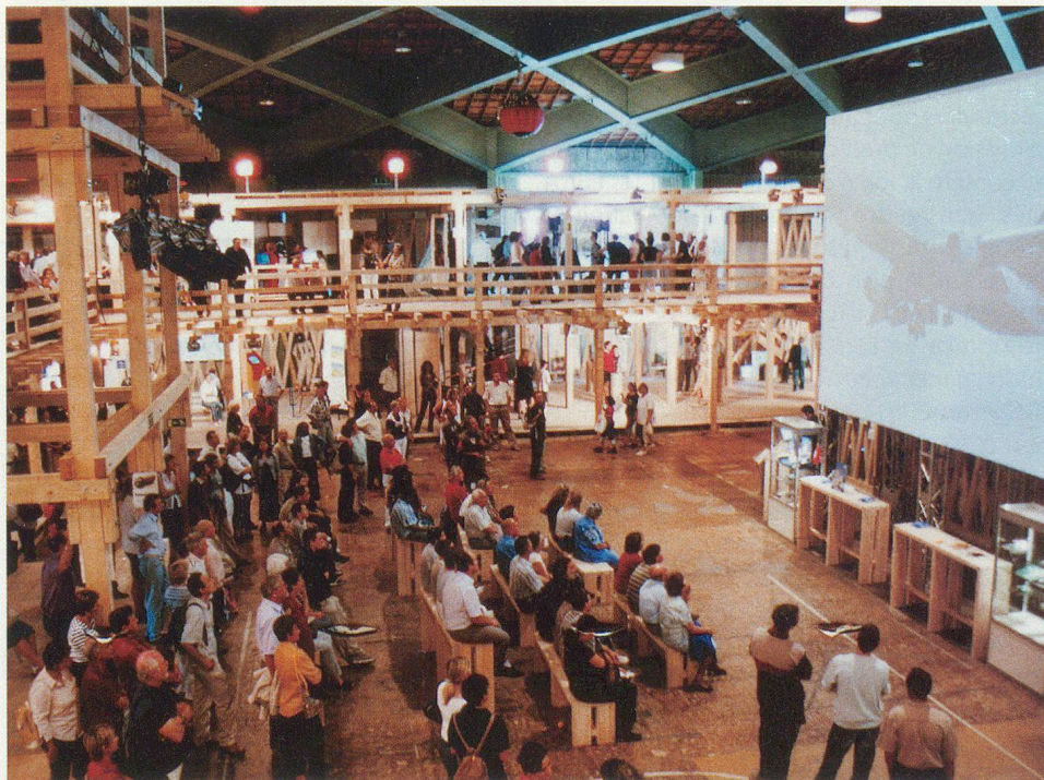
La place centrale du stand du DDPS, véritable agora.

On rétorquera, avec raison peut-être, que ce n'est plus l'affaire de l'OFPP de mettre en