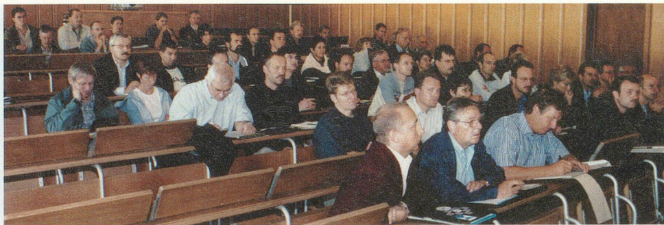
Aus dem ganzen Kanton Solothurn fanden sich in der Klus bei Balsthal rund 60 Zivilschutzverantwortliche zusammen.

KANTON SOLOTHURN: KOMMANDANTEN UND STELLENLEITER DEPONIEREN SORGEN UND WÜNSCHE