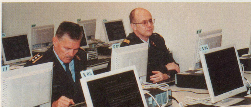
Les résultats des tests sont classés «secret-défense»...