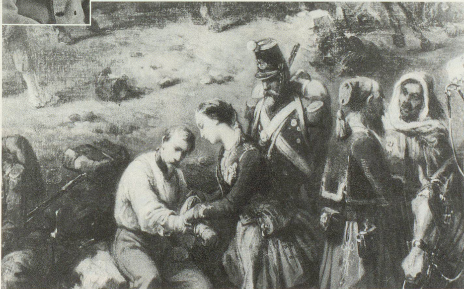
Bataille de Solferino – 24 juin 1859.

«Cette année la Journée mondiale revêt un caractère particulièrement solennel car elle coïncide avec le 175 e anniversaire de la naissance de Henry Dunant. Cet événement est l'occasion de souligner que l'esprit éclairé de l'illustre Genevois a été à l'origine du droit international humanitaire et du mouvement universel d'entraide et de secours qu'est la Croix-Rouge. La guerre en Irak nous rappelle le rôle indispensable et irremplaçable de la Croix-Rouge lors d'un conflit armé, pour protéger les soldats blessés ou prisonniers ainsi