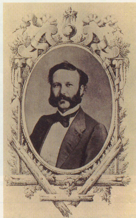
Henry Dunant, 1863.

Dunant fasste seine Gedanken und Erfahrungen im Buch Eine Erinnerung an Solferino zusammen und startete einen Aufruf an die Weltöffentlichkeit, in allen Ländern Vereine zu bilden für die Hilfe an Verwundeten. In der