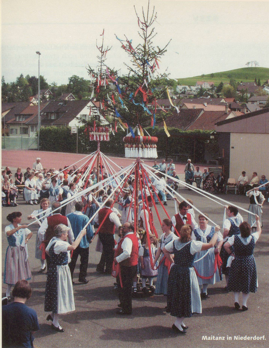
Maitanz in Niederdorf.