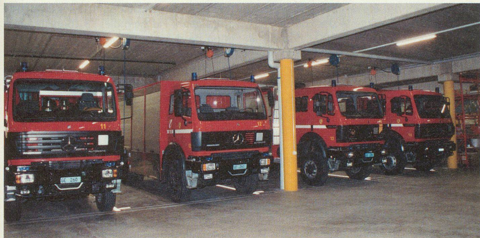
Les imposants camions mis à disposition dans le cadre du plan Carbura.

Cette présentation a été suivie d'une visite du bâtiment, sous la conduite du capitaine Pascal Fleury, commandant des sapeurs-pompiers de Vernier. □