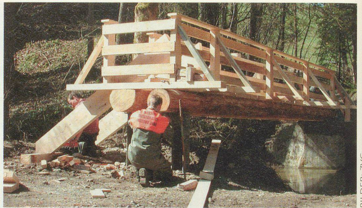
Neue Wanderwegbrücke bei der Brisigmüli an der Grenze Schwellbrunn/Urnäsch: Insgesamt baute allein die ZSO Hinterland fünf solcher Brücken.

AUSSERRHODER ZIVILSCHUTZ WIEDER IM EINSATZ