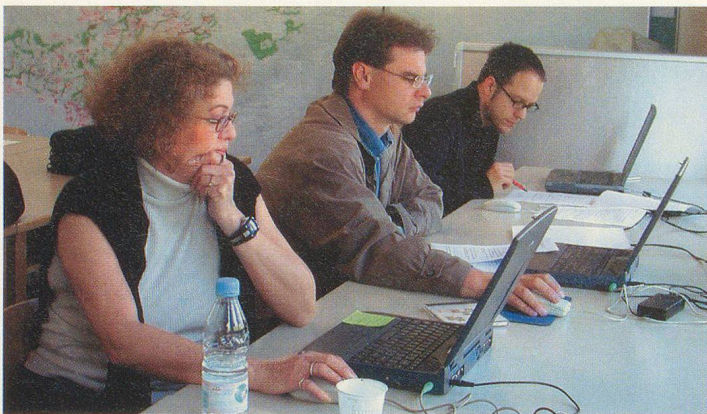
Führungsunterstützung: Mitglieder der Nachrichtengruppe des Kantonalen Führungsstabes AR werden im Ausbildungszentrum Teufen geschult.