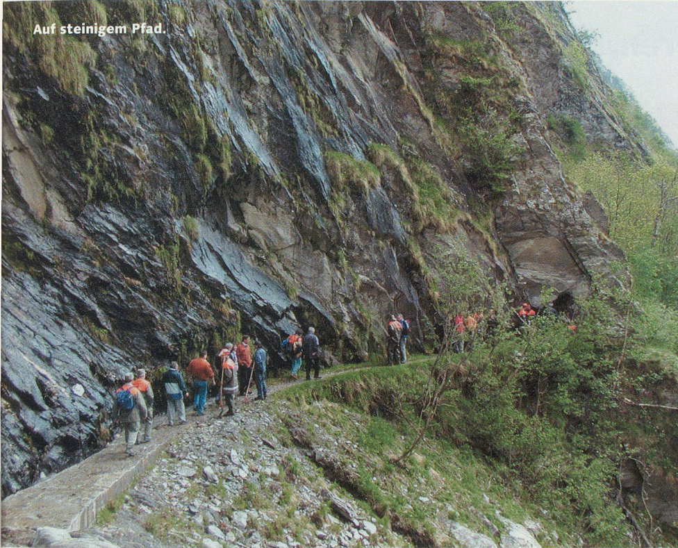
Auf steinigem Pfad.

Arbeiten, wies aber auch darauf hin, dass diese Arbeiten zum Teil wiederkehrende seien: «Jeder Winter bringt Lawinen, das Geröll muss aus den Wasserleitungen entfernt werden, Rutsche lassen Material liegen, das wir wegräumen müssen.» Eine wahre Sisyphusarbeit, mit welcher die Bergler der Natur ihr Wasser abtrotzen. «Die Kubikmeter sind weggeräumt – und das da oben kommt beim nächsten starken Regenfall wieder herunter», zeigte er in die steilen Felswände. «Eigentlich sollten diese Arbeiten die Alpwirtschaft machen – aber heute hat es ja keine Leute mehr, die für 8 Franken Taglohn Gemeinwerk leisten.» Deshalb versuche er mit dem Zivilschutz die nötigsten Arbeiten zu erledigen, «Zivilschutz va isch u Zivilschutz va Solothuru.» Denn seine Gemeinde, die Berggemeinden an den Walliser Südhängen, seien auf das Wasser angewiesen: «Ohne Wasser geht nichts, die Landwirtschaft nicht, die Hänge verdorren und erodieren.»