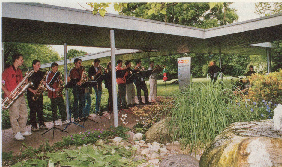
L'apéritif-concert du Big Band de l'Ecole de musique de Therwil.