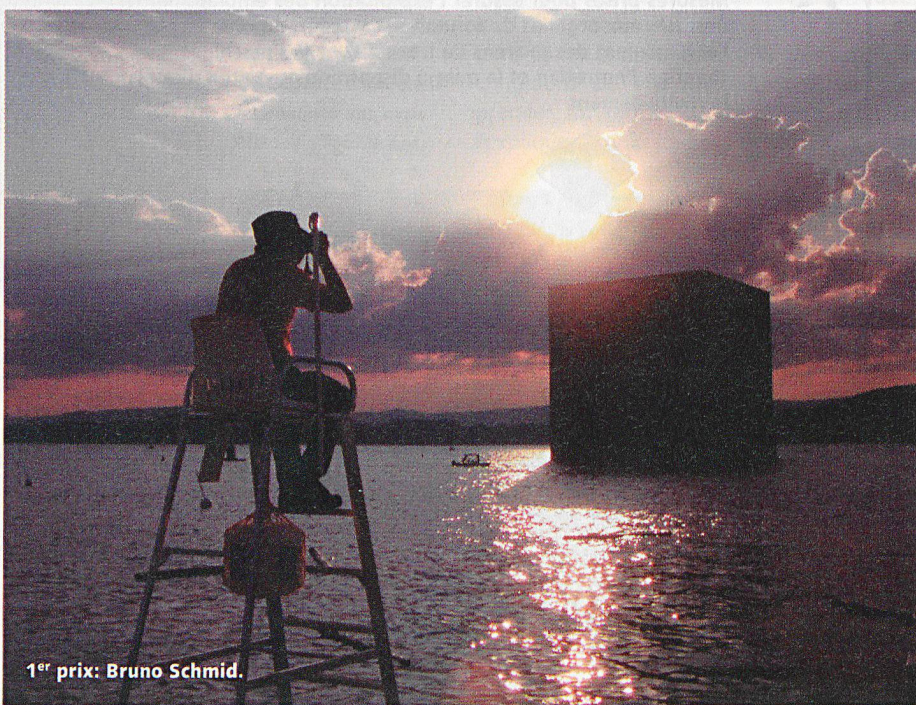
1 er prix: Bruno Schmid.

membres de la protection civile ont ainsi effectué près de 23 000 jours de service au profit de la sécurité civile de l'Expo.02. Les membres de la PCI ont ainsi passé plus de 70 000 heures à surveiller les rives des artep-lages. Ils ont par ailleurs enregistré 9600 objets trouvés, 5600 annonces d'objets perdus et ont pu restituer 3700 objets à leurs propriétaires. De plus, 23 équipes comptant de 10 à 20 sanitaires et venant de 18 cantons, soit environ 270 sanitaires de la protection