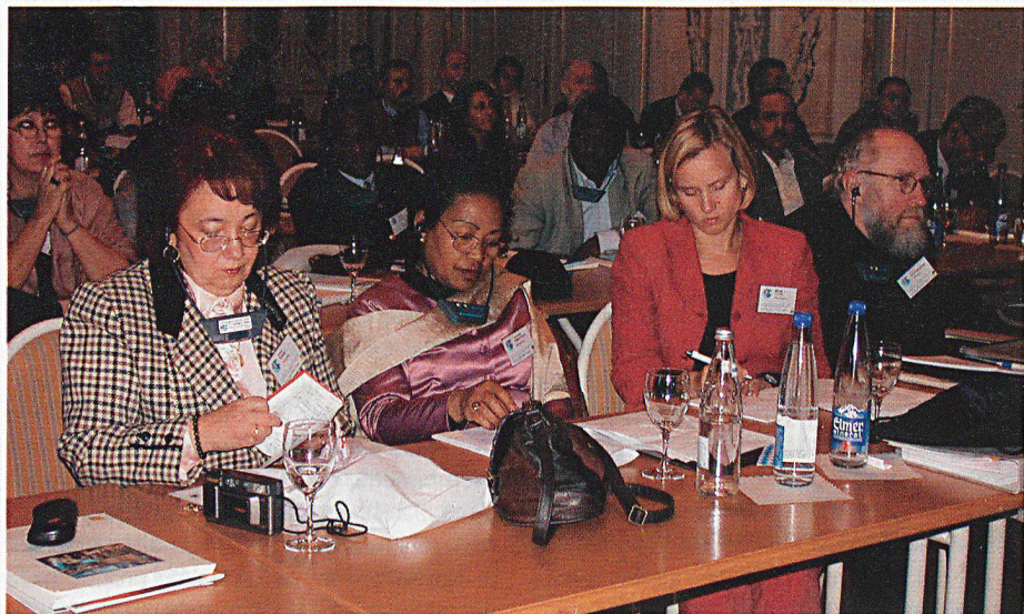
... come pure ospiti e rappresentanti di diverse organizzazioni.

«Le misure preventive adottate in tempo di pace per salvaguardare i beni culturali dagli effetti prevedibili di un conflitto armato conformemente all'articolo 3 della Convenzione comprendono, se necessario, l'allestimento di inventari, la pianificazione di provvedimenti urgenti volti ad assicurare la protezione dei beni culturali contro i rischi d'incendio o di crollo di edifici, la preparazione dell'evacuazione o la protezione in loco dei beni culturali mobili nonché la designazione delle autorità responsabili della tutela dei beni culturali.»