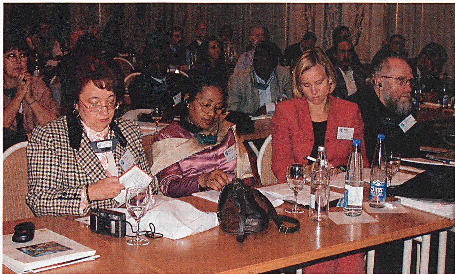
... come pure ospiti e rappresentanti di diverse organizzazioni.

manifestazione. È ancora presto per sapere quali saranno gli effetti del Congresso sulle future attività internazionali nel campo dei beni culturali. Esso ha però sicuramente contribuito ad accelerare i tempi previsti per l'entrata in vigore del secondo protocollo aggiuntivo, che nel frattempo è stato ratificato dal quindicesimo Stato.