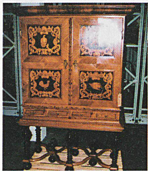
Anche i mobili costituiscono importanti pezzi da collezione.

UFPC. Nel centro di raccolta di Affoltern am Albis vengono conservati oltre 25 000 oggetti appartenenti al Museo nazionale svizzero. Il Comitato svizzero della protezione dei beni culturali (vedi riquadro) ha scelto questo luogo per il suo rapporto annuale 2002, cogliendo l'occasione per conoscere la collezione.