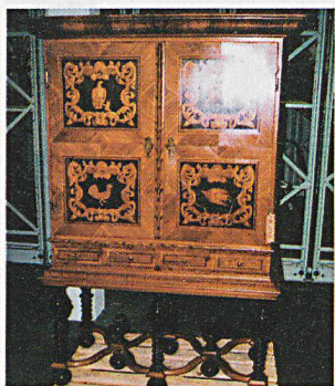
Anche i mobili costituiscono importanti pezzi da collezione.

UFPC. Nel centro di raccolta di Affoltern am Albis vengono conservati oltre 25 000 oggetti appartenenti al Museo nazionale svizzero. Il Comitato svizzero della protezione dei beni culturali (vedi riquadro) ha scelto questo luogo per il suo rapporto annuale 2002, cogliendo l'occasione per conoscere la collezione.