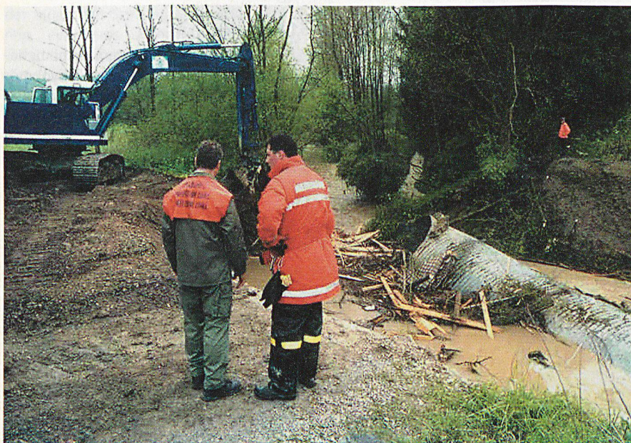
Vertreter von Feuerwehr und Zivilschutz beim Dammbau an der Thur in der Gemeinde Niederbüren: Der Hagelsturm vom Mai 2001 hatte im Fürstentland schwere Verwüstungen angerichtet.

Der schrittweise Abbau des Zivilschutzpersonals leitet die Umsetzung des Projekts Bevölkerungsschutz 200X ein. Dies bekommen die Ausbildungszentren bereits jetzt stark zu spüren: Die Zahl der Ausbildungstage ist markant zurückgegangen. Aus diesem Grund wird nun die interkantonale Zusammenarbeit vorangetrieben. Die Kantone St.Gallen und beide Appenzell wollen in den nächsten Jahren die Ausbildung koordinieren. □