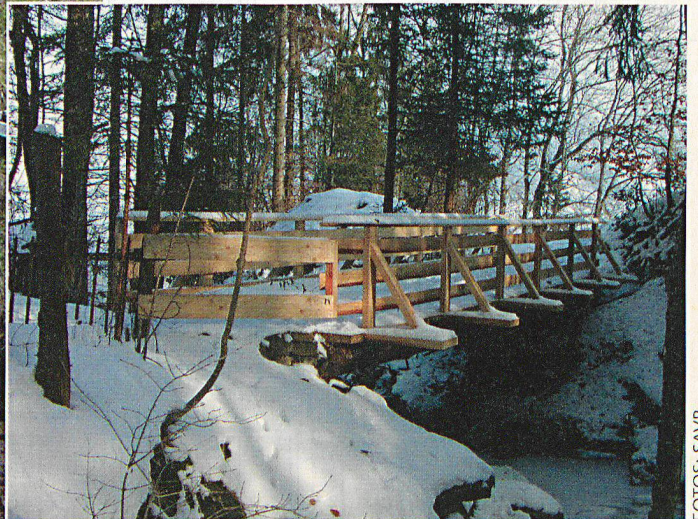
Wanderweg-Brücke in Urnäsch, im vergangenen Sommer erstellt vom Zivilschutz Hinterland.