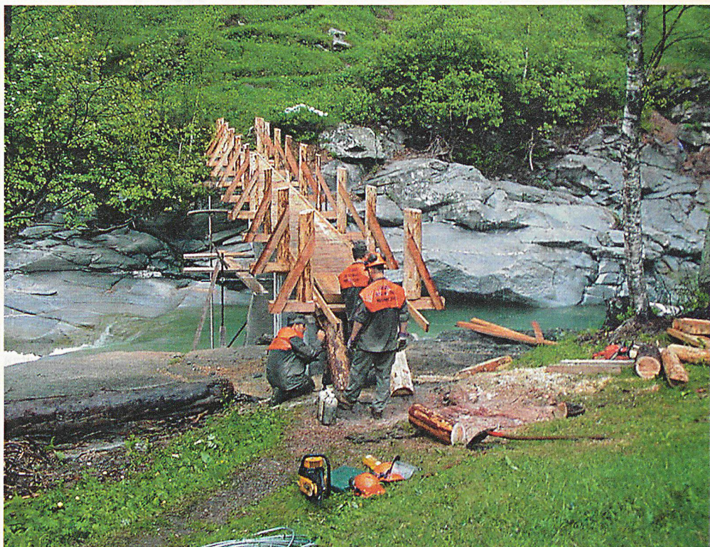
Appenzeller Zivilschützer leisten im Mai 2001 auf freiwilliger Basis Aufbauhilfe in der vom Unwetter schwer geschädigten Region Gondo.

Zur Beseitigung der «Lothar»-Sturmschäden hat der Zivilschutz des Kantons St.Gallen