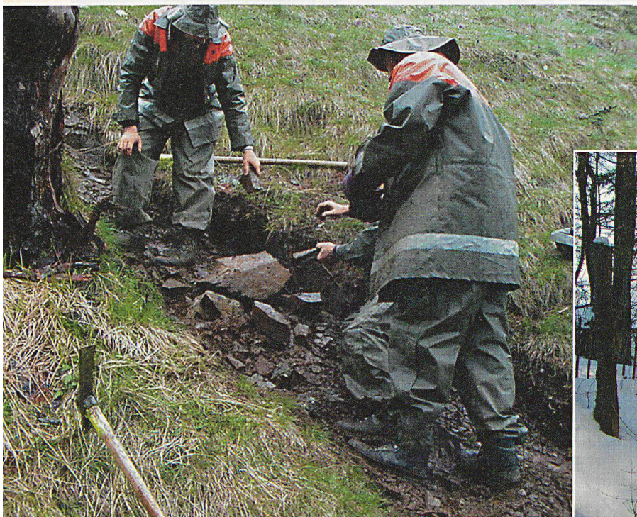
Appenzeller Schutzdienstpflichtige leisten im Mai 2001 auf freiwilliger Basis Aufräumhilfe in der Walliser Region Gondo.

Innerrhoder Zivilschützer wirkten bei der Erweiterung des Schiessstandes «Clanx» mit. Auf Gesuch der Luftseilbahn Ebenalp wurde die Stützenfundamente des Skilifts Berg abgebrochen. Dazu kamen diverse Unterstützungsleistungen in den einzelnen Bezirken, Arbeiten an Wander- und Bikewegen, Ausbesserungen des Skilifttrassees «Sollegg» und die Sanierung des Steges «Alte Säge» in Eggerstanden. □