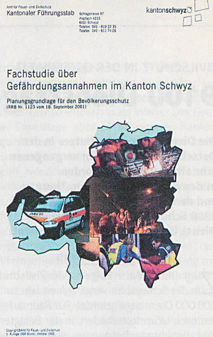
Die 75-seitige Fachstudie im Format A4.