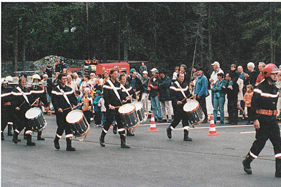
Les pompiers défilent devant la population.