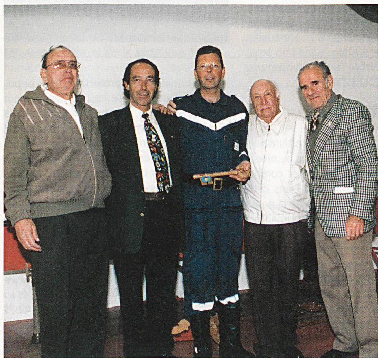
Cinq générations de commandants du feu (ils se reconnaîtront).