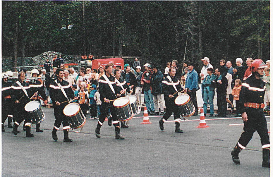
Les pompiers défilent devant la population.