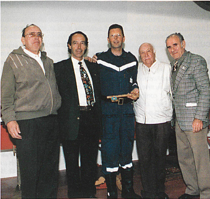
Cinq générations de commandants du feu (ils se reconnaîtront).