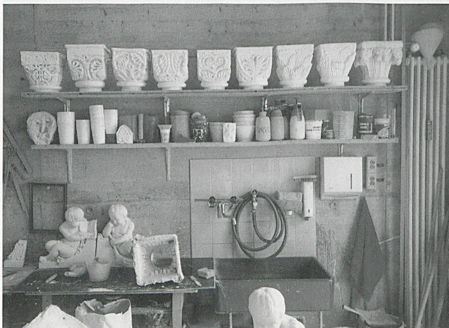
Dès Antiquité, on a constitué des collections importantes à des fins d'étude, et il n'est pas rare que ces copies soient un jour presque aussi précieuses que les originaux.