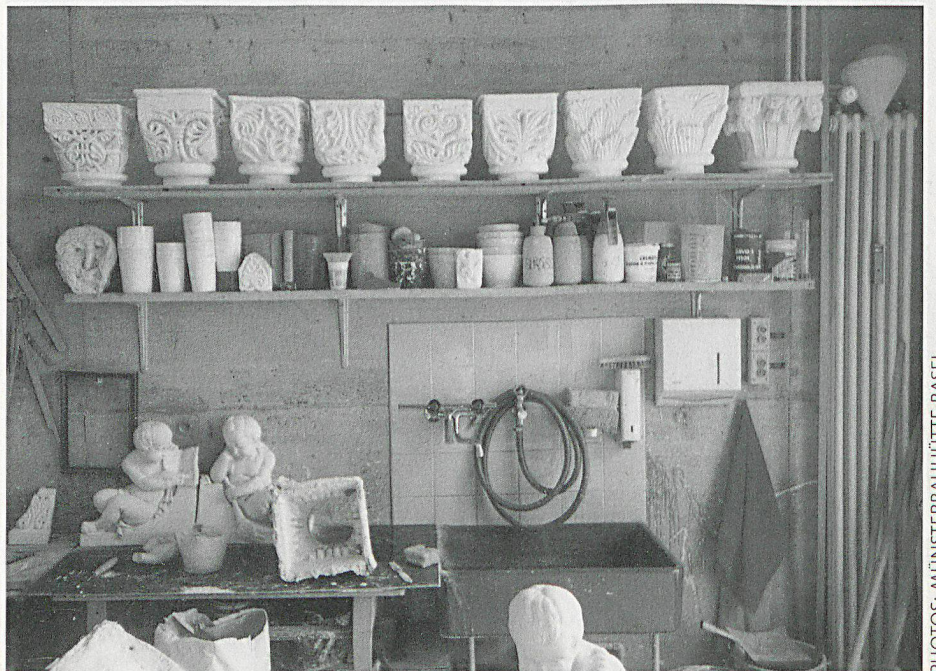
Dès Antiquité, on a constitué des collections importantes à des fins d'étude, et il n'est pas rare que ces copies soient un jour presque aussi précieuses que les originaux.