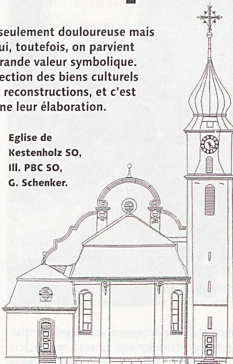
Eglise de Kestenholz SO, III. PBC SO, G. Schenker.

truit, telle est justement la fonction d'une documentation de sécurité. Une telle documentation présente une utilité même si la perspective d'une restauration ou d'une reconstruction est écartée dans une volonté de conserver le patrimoine tel qu'il nous parvient: elle sert alors au moins de nécrologie scientifique.