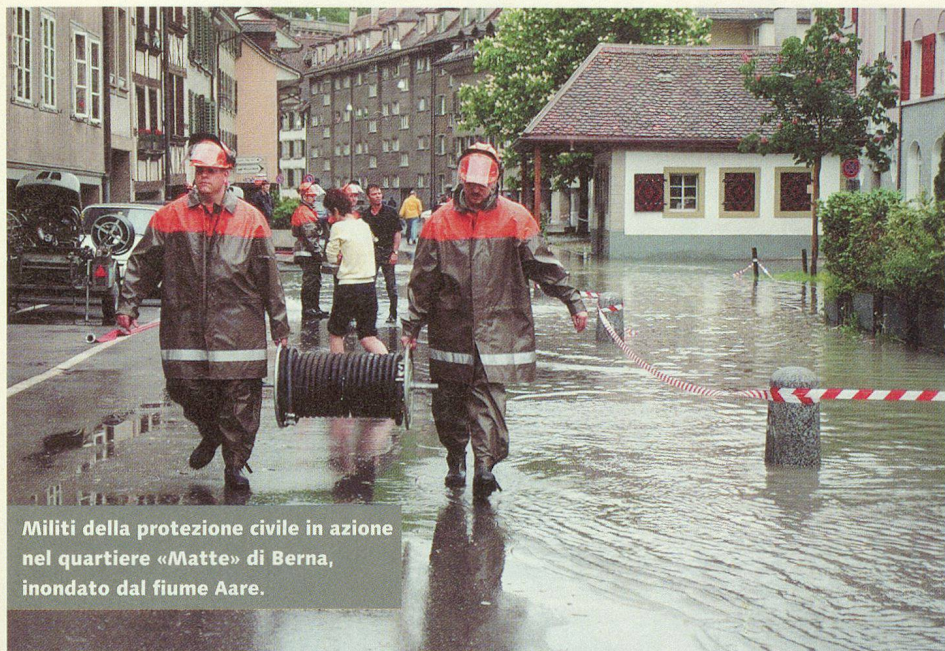
Militi della protezione civile in azione nel quartiere «Matte» di Berna, inondato dal fiume Aare.

Tutti i corsi di ripetizione, indipendentemente dal grado gerarchico dei partecipanti, richiedono molta fantasia per offrire ogni volta un'istruzione molto vicina alla realtà.