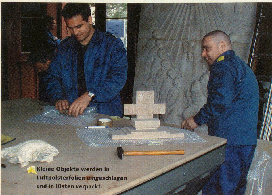
Kleine Objekte werden in Luftpolsterfolien eingeschlagen und in Kisten verpackt.