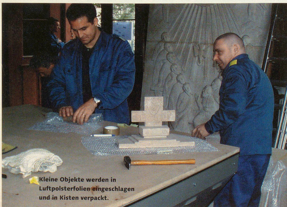
Kleine Objekte werden in Luftpolsterfolien eingeschlagen und in Kisten verpackt.