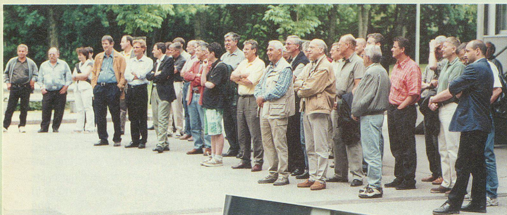
Alle lauschten gespannt auf die Worte des grossen Häuptlings.