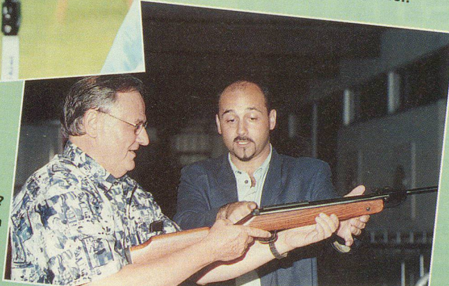
«Alles klar? Hier musst du zielen und dort abdrücken.»