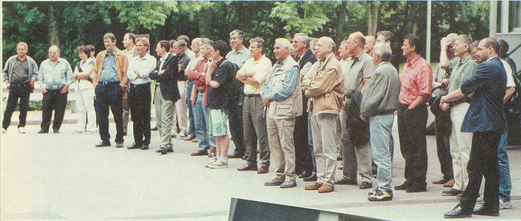
Alle lauschten gespannt auf die Worte des grossen Häuptlings.