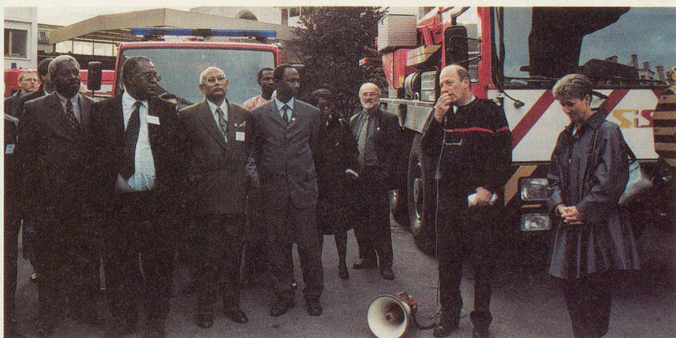
Visite de la caserne principale du SIS.

Durant ces deux jours, les participants ont encore visité le SIS de Genève, complété par un exercice à la gare de la Praille, qui a mis en œuvre un véhicule spécialisé rail-route des sapeurs-pompiers, ainsi qu'un des trains d'extinction et de sauvetage des CFF. Ils ont également eu l'occasion de visiter l'Hôpital cantonal et de prendre connaissance du plan catastrophe genevois (ISIS).