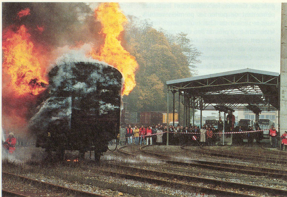
Le wagon s'embrase...