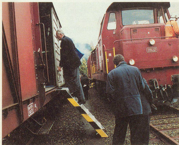
Visite du train d'extinction des CFF.