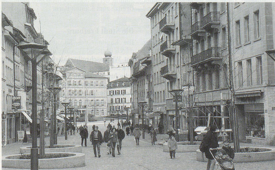
Rue piétonne dans le centre ville; à noter l'opposition des styles!

(La documentation a été aimablement fournie par l'Office du tourisme de Fribourg et l'Union Fribourgeoise du Tourisme à qui la rédaction adresse toute sa gratitude.)