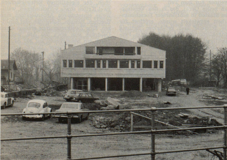
Das Hauptgebäude der Zivilschutzanlage in Bätterkinden

Die Kurse bringen auch grosse administrative Vorbereitungs- und laufende Organisationsarbeiten mit sich, die nur ein vollamtlicher Verwalter bewältigen kann. Gegenwärtig wird für das neue Zentrum in Bätterkinden sowohl ein Verwalter wie auch ein hauptamtlicher Abwart gesucht. Zum Aufgabengebiet des Abwarts gehört neben anderem auch der Unterhalt der Uebungspiste, die ebenfalls noch im Bau ist und direkt hinter dem Hauptgebäude erstellt wird. Die Uebungspiste entspricht den Vorschriften des Zivilschutzes und umfasst ein Brandhaus, eine Trümmerpiste und andere Uebungsobjekte. Die ersten Kurse werden, wenn alles gut läuft, was durchaus anzunehmen ist, am 1. März 1973 in Bätterkinden beginnen; es ist vorgesehen, den Saal schon früher für Veranstaltungen freizugeben. Das neue Zentrum wird ohne Zweifel mehr Leben in die Ortschaft bringen, und zwar nicht nur wegen des Zivilschutzes sondern weil im neuen Saal auch andere Veranstaltungen möglich werden. Bereits heute spricht man von Theateraufführungen und dergleichen.