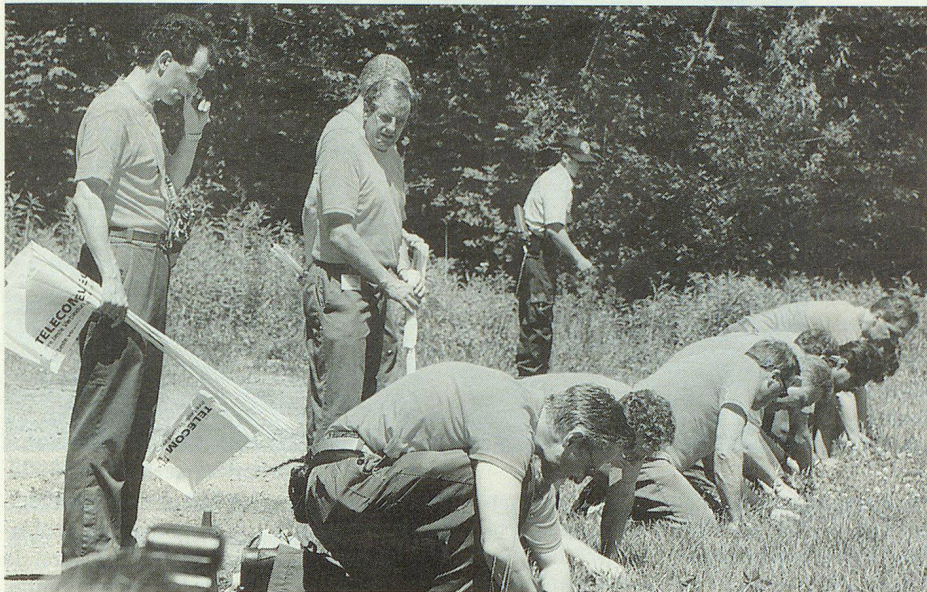
Mit voller Konzentration bei der Kleindurchsuchung.