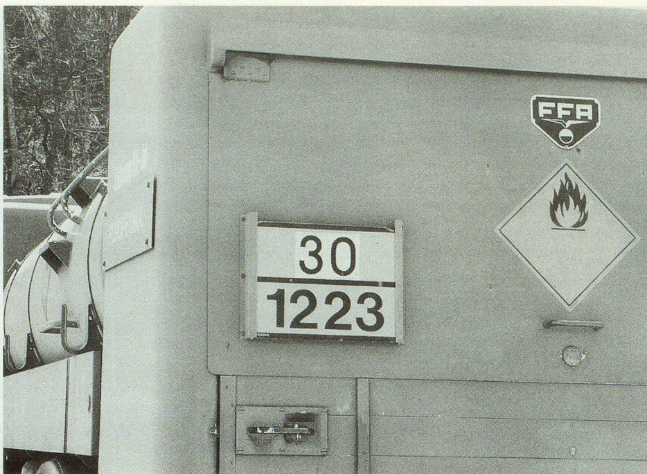
Trasporto di merci pericolose: è prescritta la leggenda esatta della merce.

Nell'elaborazione dell'ordinanza sulla protezione contro gli incidenti rilevanti ci si è resi conto fin dall'inizio che non solo nelle aziende chimiche esistono potenziali di pericolo che possono provocare gravi incidenti rilevanti. Per questo era giusto inserire il trasporto di merci pericolose nel campo d'applicazione dell'ordinanza. Per mantenere i costi entro certi limiti si è tenuto conto solo di quelle strade sulle quali presumibilmente viene trasportata la maggior parte delle merci pericolose. Si tratta