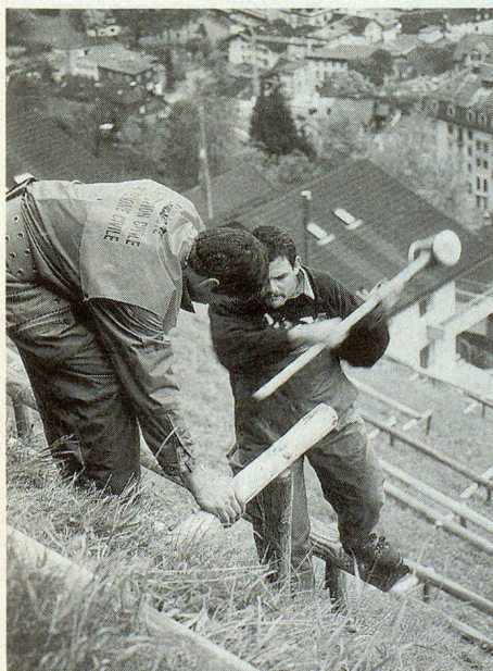
Solide Sicherungen im steilen Hanggebiet oberhalb des Dorfes.

Der Einsatz des Zivilschutzes war für die Heimbewohnerinnen und -bewohner trotz Umzugstrubel eine willkommene Abwechslung.