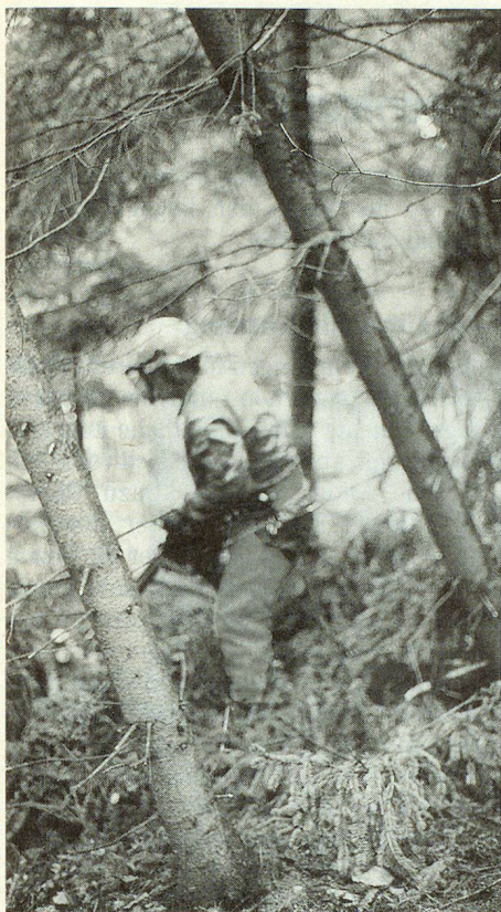
Ganz ungefährlich ist in diesem Chaos der Räumeeinsatz nicht.

gen eine Arbeitsleistung für die Allgemeinheit und vor allem für die zum Teil schwer betroffenen Bauern. Es tut auch gut, wieder einmal die Natur zu spüren und ihr Wirken zu erleben.»