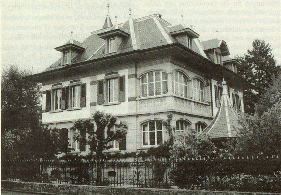
Die Villa Bahnhofstrasse 5 in Murten (C-Objekt).

Die Angaben und Fotos wurden in verdankenswerter Weise von Martin Bula, DC KGS Stv, zur Verfügung gestellt.