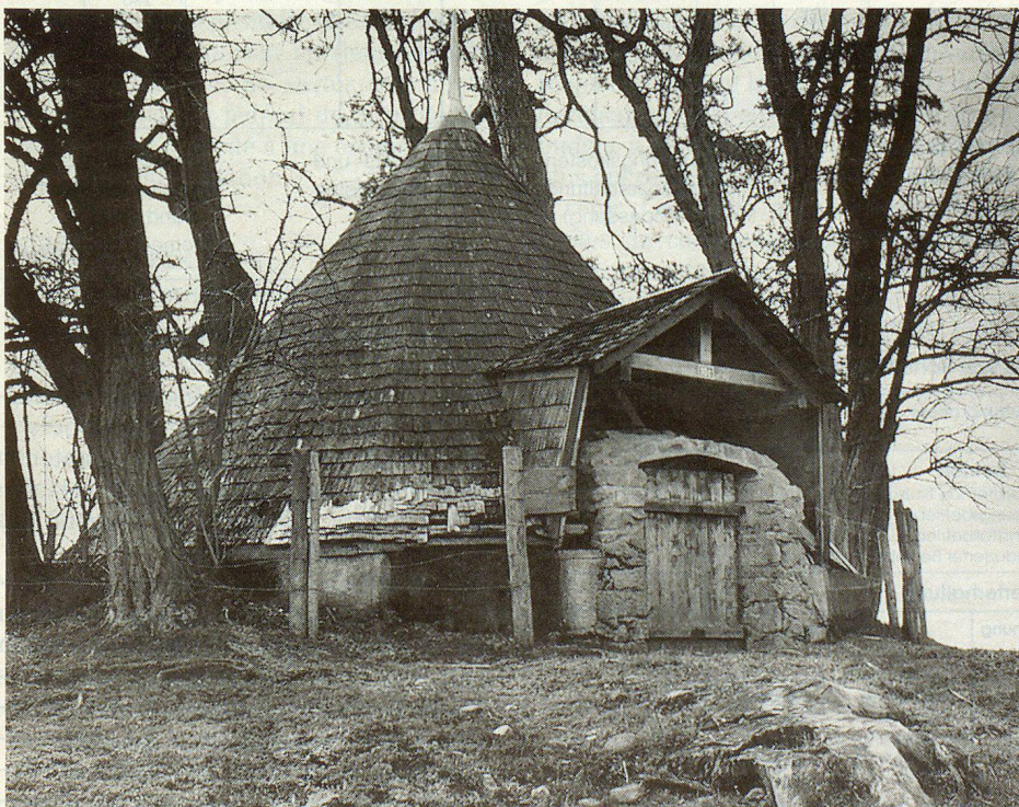
Der Eisspeicher in Greng – ein C-Objekt.