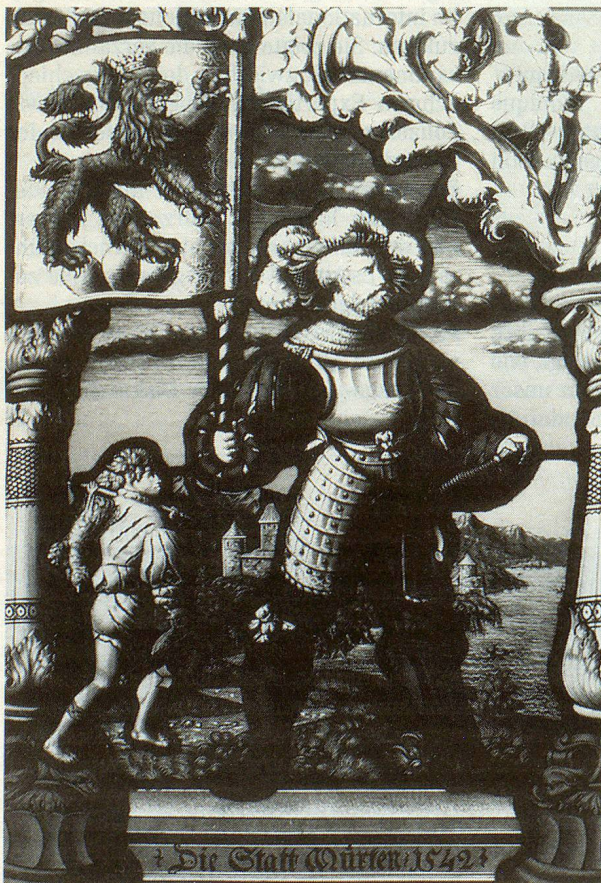
Wappenscheibe der Stadt Murten von 1542.

Eines der dringendsten Probleme im KGS Murten ist das Fehlen von KGS-Schutzräumen. Nur schon die 150jährige Sammlung