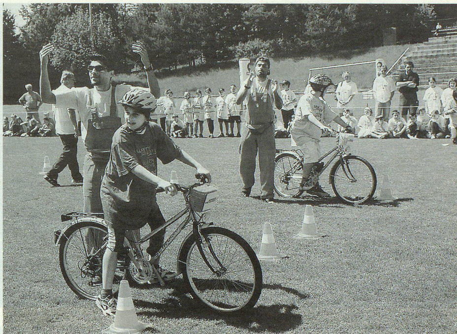
Superstimmung herrschte vom Start bis ins Ziel.