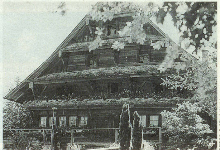
Der im Jahr 1679 erbaute Blockständerbau im Unterdorf.