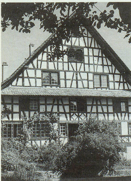
Der schönste Riegelbau von Rifferswil mit der Giebelattribution 1788.