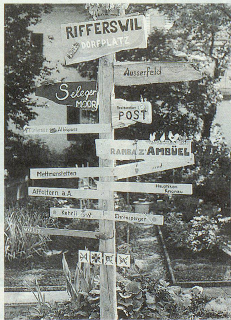
In Rifferswil sind sogar die Wegweiser anders.