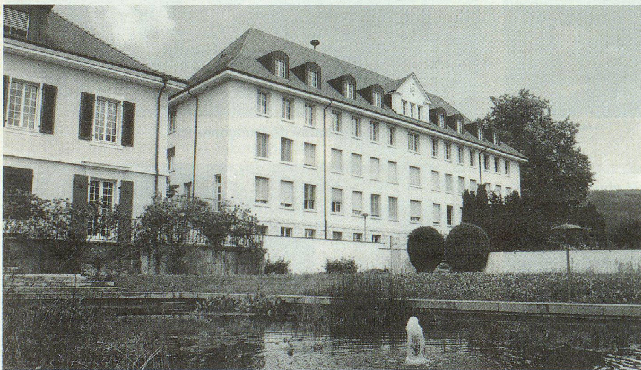
L'Institut agricole jurassien à Courtemelon.

Als Mitglied des Schweizerischen Zivilschutzverbandes erhalten Sie die Zeitschrift «Zivilschutz» gratis nach Hause geliefert!