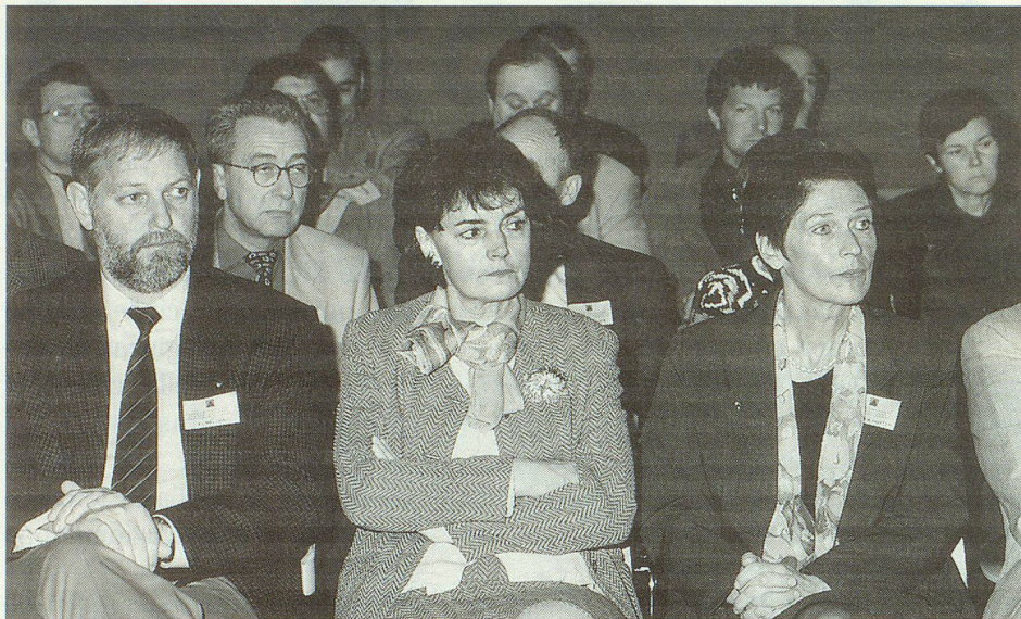
Über 70 Delegierte des SZSV und zahlreiche Gäste verfolgten die Abwicklung der Geschäfte.