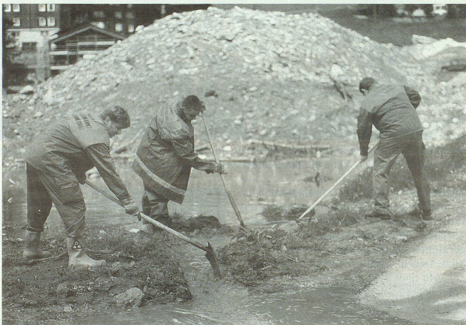
Die Windischer Zivilschützer bei der Arbeit auf dem Lawinenkegel.

Die Lawinenniedergänge hinterliessen verheerende Spuren. Ein mehrere hundert Meter breiter und meterhoher Schnee- und Schuttkegel, durchmischt mit Geröll, Baumstämmen oder zwischendurch mal mit einem Autowrack türmte sich auf. Die weissen Massen hatten alles mitgerissen: mehrere Häuser, Autos, Strassenschilder. Sieben Lawinen waren alle aus dem gleichen Seitental herabgedonnert. «Ich bin froh, dass das Dorf noch steht», sagte ein Geschiner Bergbauer.