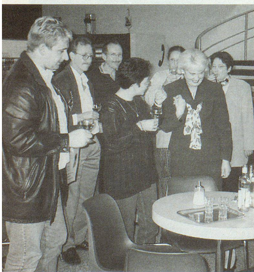
Nach Beendigung des Kurses kam auch das Gesellschaftliche nicht zu kurz.