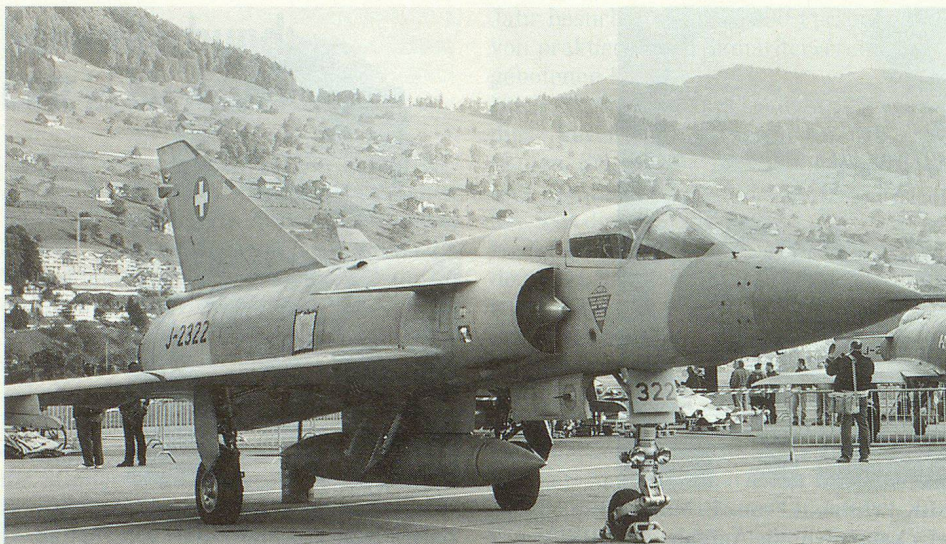
Während vieler Jahre war die Mirage IIIS der Stolz der Schweizer Luftwaffe.