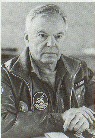
Die ernste Miene von Korpskommandant Fernand Carrel, Kommandant der Luftwaffe, sagt mehr als tausend Worte.

Eine Mischung von Bewunderung und leiser Wehmut war spürbar, als am 22. Oktober auf dem Flugplatz Buochs NW die 29 verbliebenen von einst 36 Jagdflugzeugen Mirage IIIS offiziell verabschiedet wurden. Nach 35 Einsatzjahren werden sie auf Ende Jahr ausgemustert. Sicherheitspolitische und finanzielle Gründe hatten zu diesem Entscheid geführt. Ganz vom Schweizer Himmel verschwinden wird die Mirage allerdings nicht. Die Mirage-Aufklärer und die Doppelsitzer bleiben weiter im Einsatz. Weit über 10 000 Besucherinnen und Besucher erwiesen dem schnittigen und kampfstarken Flugzeug noch einmal die Referenz, flanieren durch die Ausstellungen und bewunderten die Flugvorführungen mit Mirage IIIS, Mirage IIIRS, F-5 Tiger, F/A-18 sowie der topmodernen französischen Mirage 2000. Als Überraschung