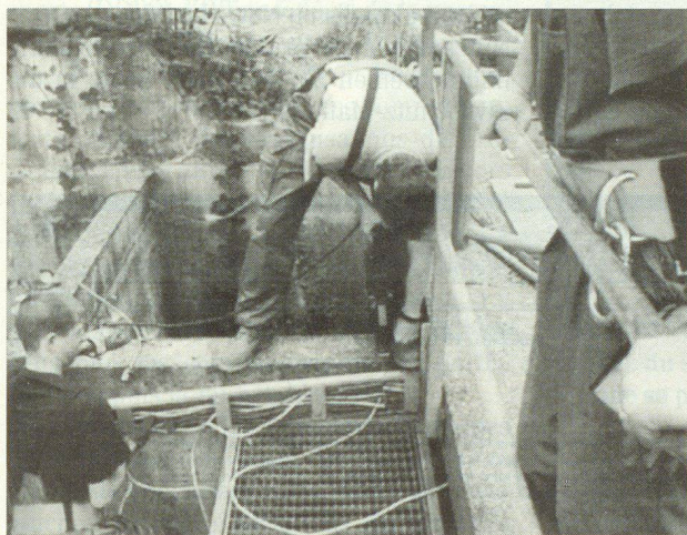
Arbeit am Abbruchobjekt. Mit Hilfe der Digitalkamera werden Fehler gleich sichtbar gemacht.