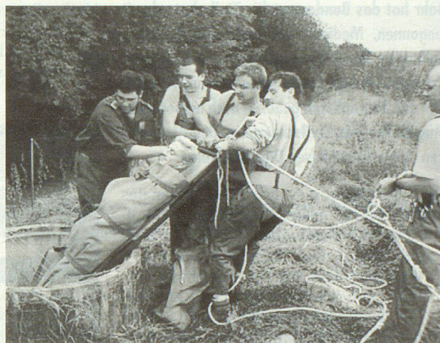
Grosses Aufatmen: Die Rettungsübung ist gelungen.