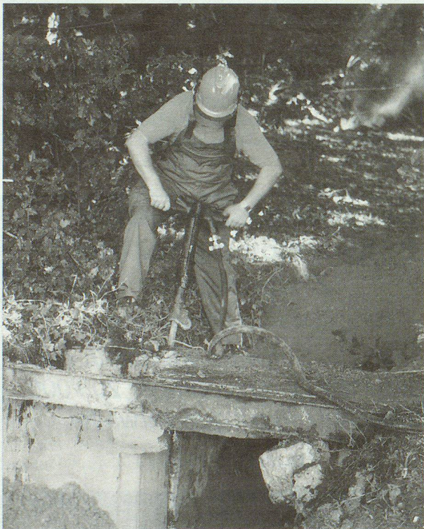
Dem alten Schiessstand wird zu Leibe gerückt.

Ins Bild aktueller Organisation des Zivilschutzes passt auch das Betreuungs-Pilotprojekt im Altersheim Lüterswil. Die Pensionäre reagierten sehr positiv. Es ist deshalb ein vermehrter Einsatz von Zivilschützern im Altersheim vorgesehen. Im Jahr 2000 wird das Lüterswiler Altersheim zudem im Rahmen einer kombinierten Rettungs- und Betreuungsübung, zusammen mit der Feuerwehr, im Mittelpunkt stehen. ■