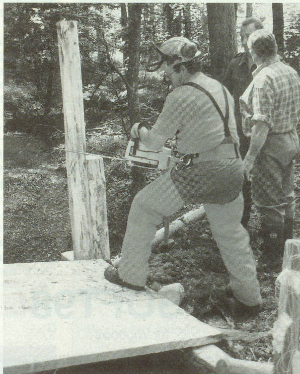
Über den Mülibach entsteht ein solider Steg.