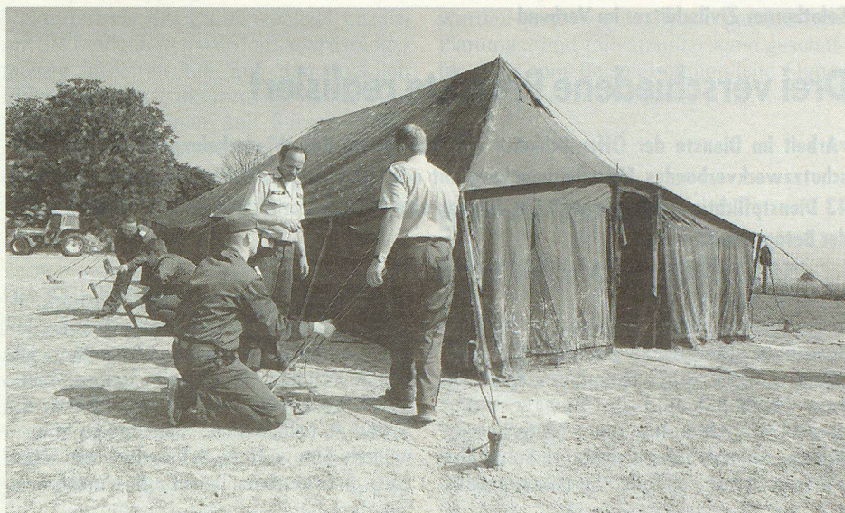
Geschafft! Das Zelt steht, die Holzplöcke sind im Boden verankert.

Eine Knacknuss war die Aufgabe schon. Vier Materialzelte 45, zwei Kommandozelte 53 mussten aufgestellt werden. Mit einer guten Auslegeordnung, Köpfchen, Prüßeln und Improvisation schafften sie es