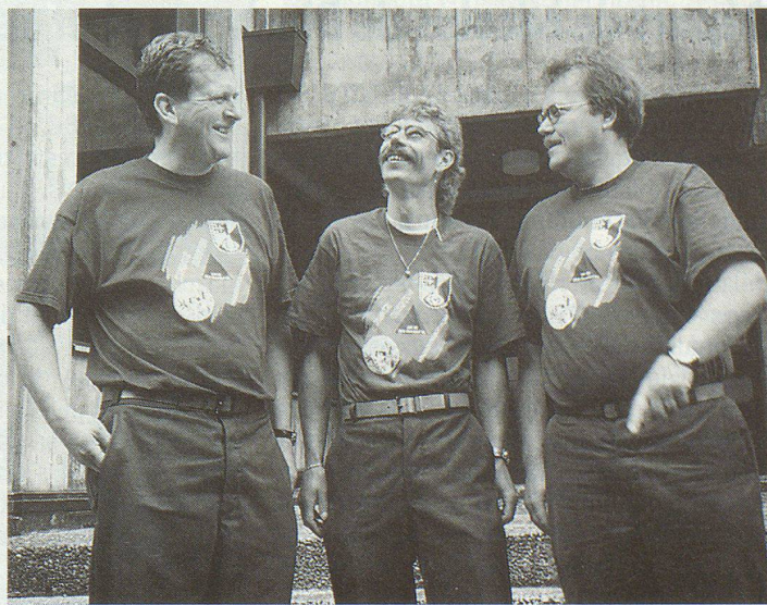
Für den Einsatz in Bristen entwarfen die Oberdörfer Zivilschützer eigens ein Tenü.